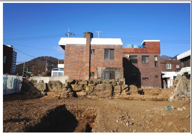
음성 일부 존재