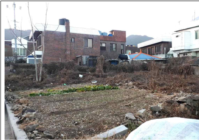
매장문화재 조사 전 모습